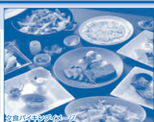
夕食バイキングイメージ